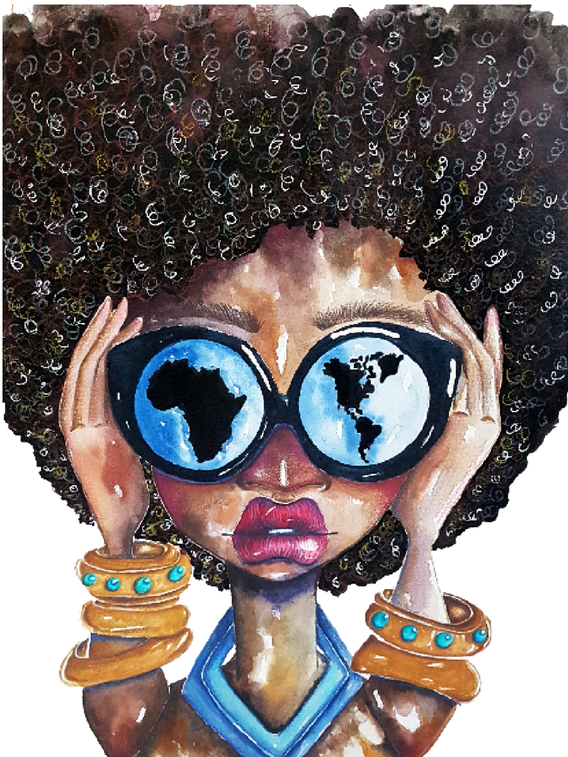
Ilustração 3 – lentes américas

Os territórios colonizados são espaços marcados pela dor e pelo silenciamento, entretanto, não podemos ser ingênuos que os corpos escravizados não seriam também corpos de lutas e resistências, como bem exemplificou Angela Davis (2016) em seu livro “Mulheres, Raça e Classe”.