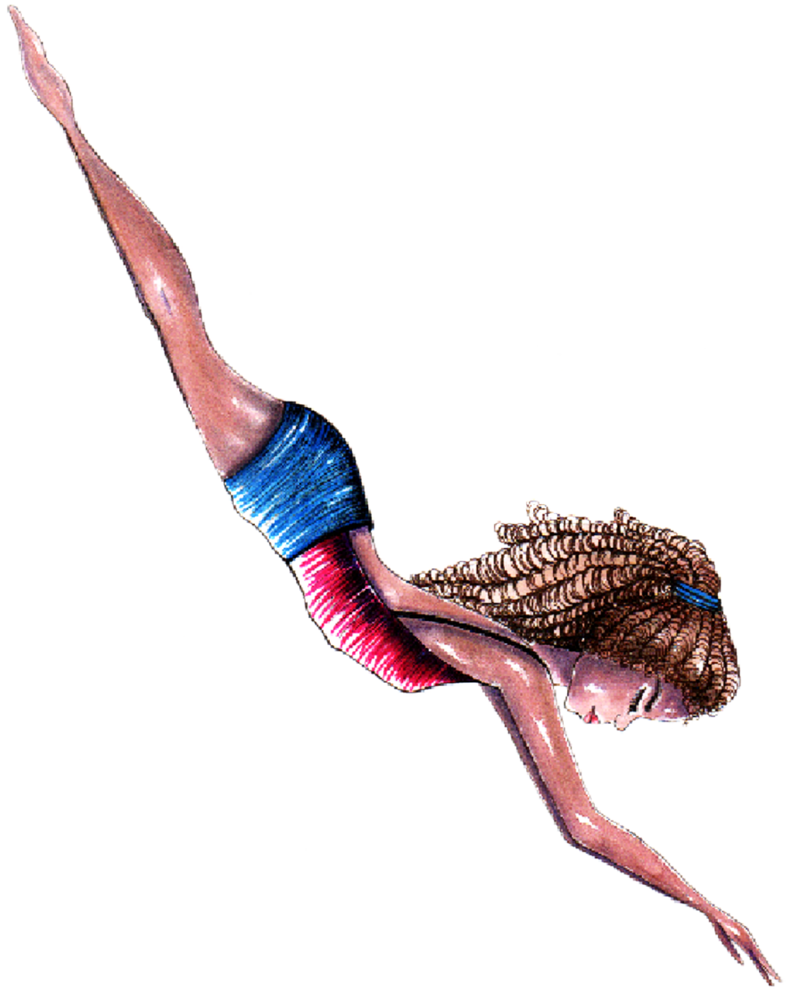
Ilustração 6 – mergulho epistêmico