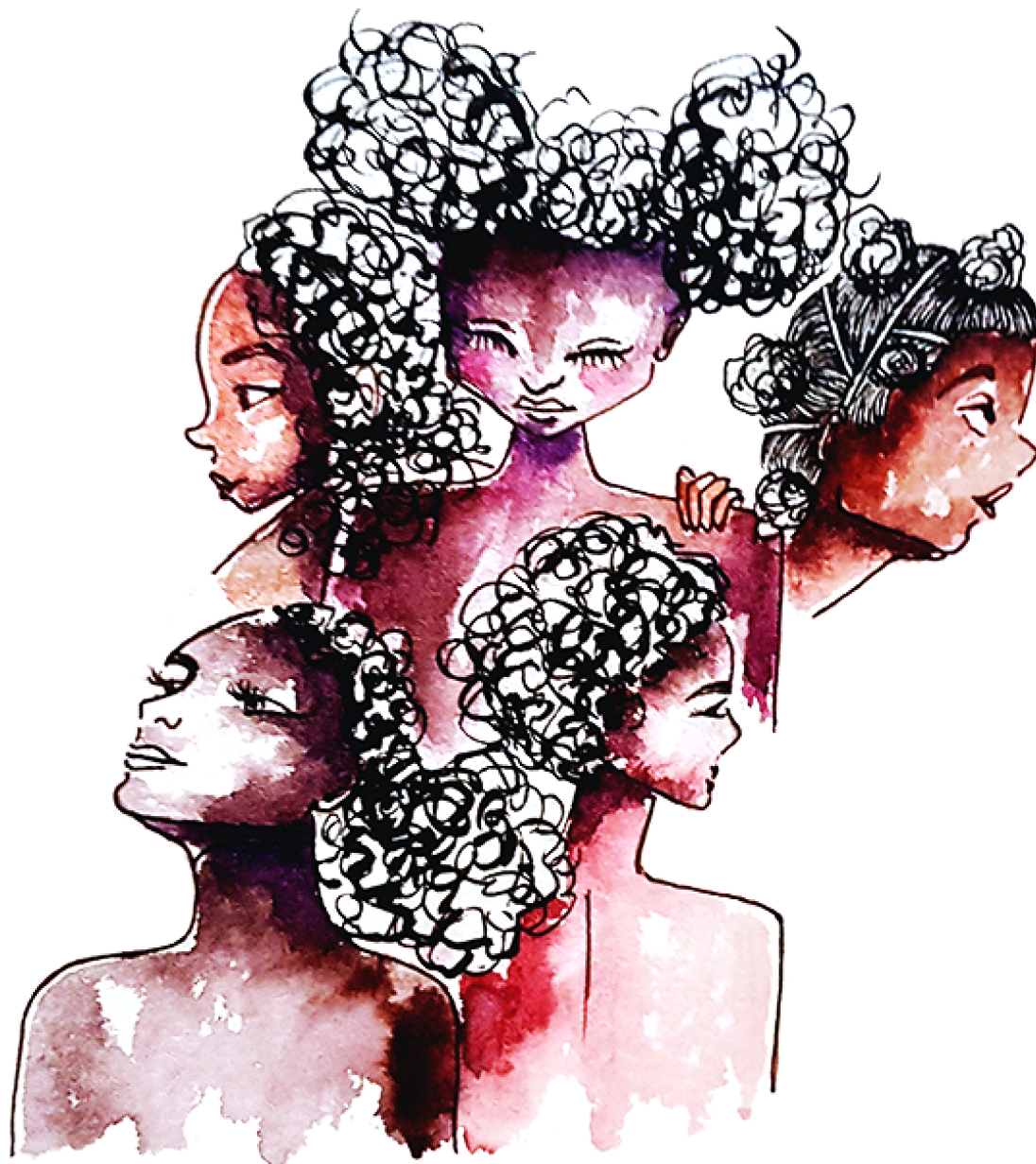
Ilustração 5 – engajamento, resistência e empoderamento

No início deste artigo apresentei a ilustração como um caminho possível na ampliação do entendimento sobre determinados conceitos. A intenção da abordagem antropológica aqui prometida era tratar as epistemologias dos feminismos negros por meio do fazer. O desenho e a ilustração são caminhos em busca de alternativas aos cânones ortodoxos do mundo acadêmico.