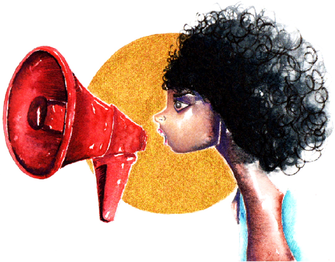
Ilustração 1 – vozes pretas

Ao propósito pujante de expressar, as possibilidades são tão infinitas que aquele espírito inquieto, citado no início, não encontra a hora de bradar as possibilidades criativas na aproximação da ilustração com os pensamentos feministas negros com a finalidade de ampliar os horizontes epistêmicos.