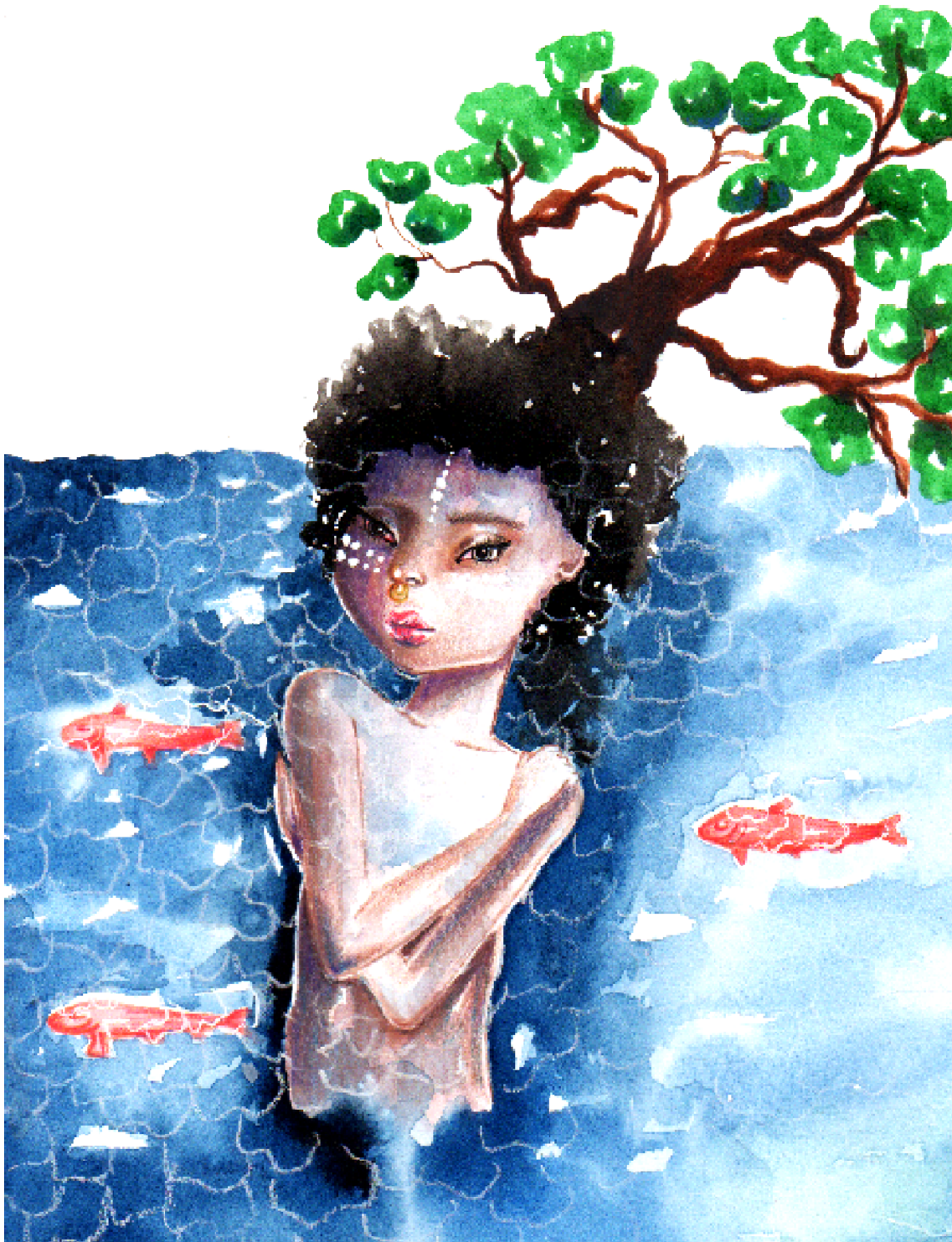
Ilustração 1 - o entre lugar

É importante ressaltar que neste contexto de extermínio, invisibilidade e apagamento o campo do conhecimento foi construído. A ciência advinda pelo projeto iluminista tinha como base o pressuposto de se considerar como universal, isenta, neutra